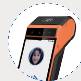
可选3D结构光人脸识别摄像头